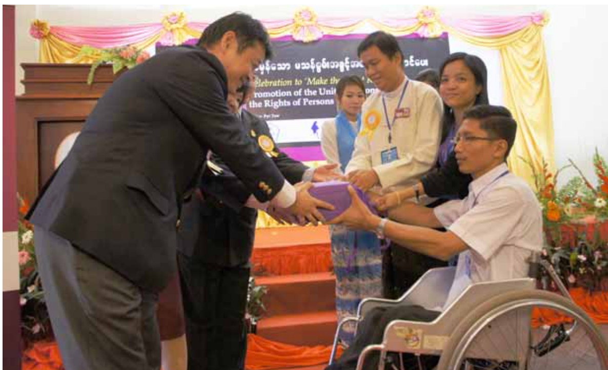
Presenting 'Make the Right Real' Pens and the Roll-up to Organizers in Myanmar