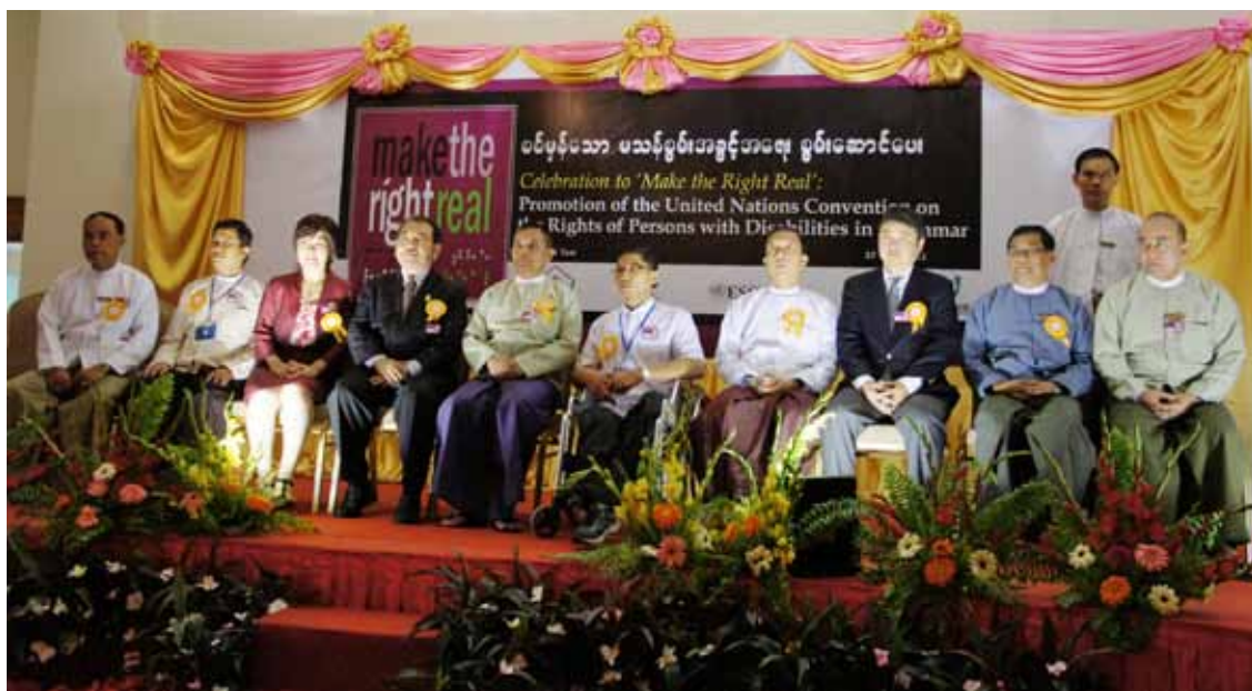
Group Photo of Organizers

The event was reported by the government TV program, international TV program as well as local newspapers.