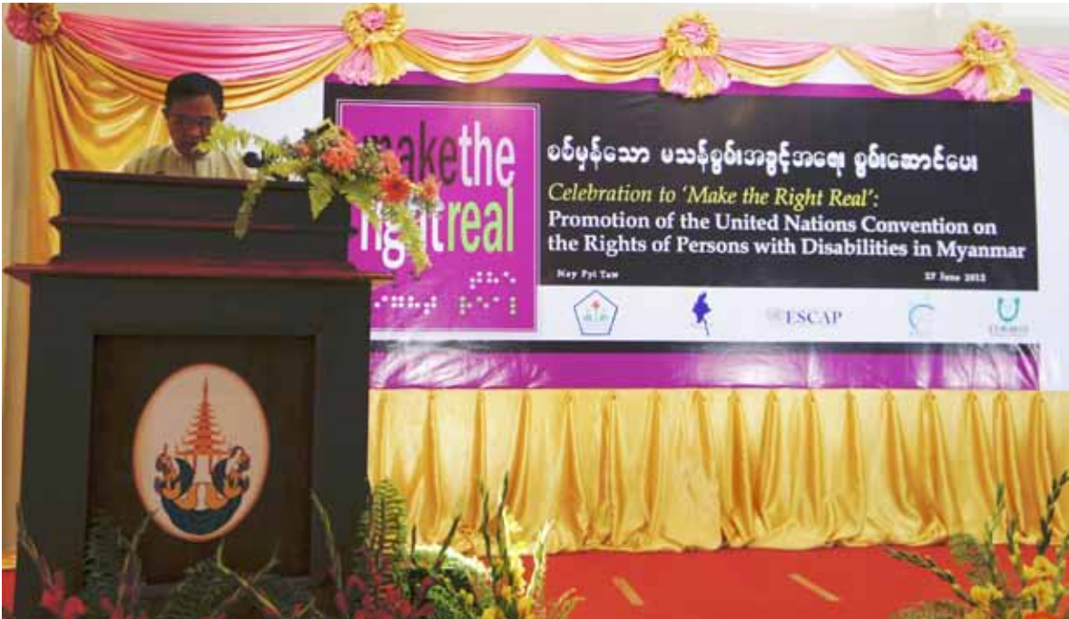
Welcome Speech by the Union Minister for the Ministry of Social Welfare, Relief and Resettlement