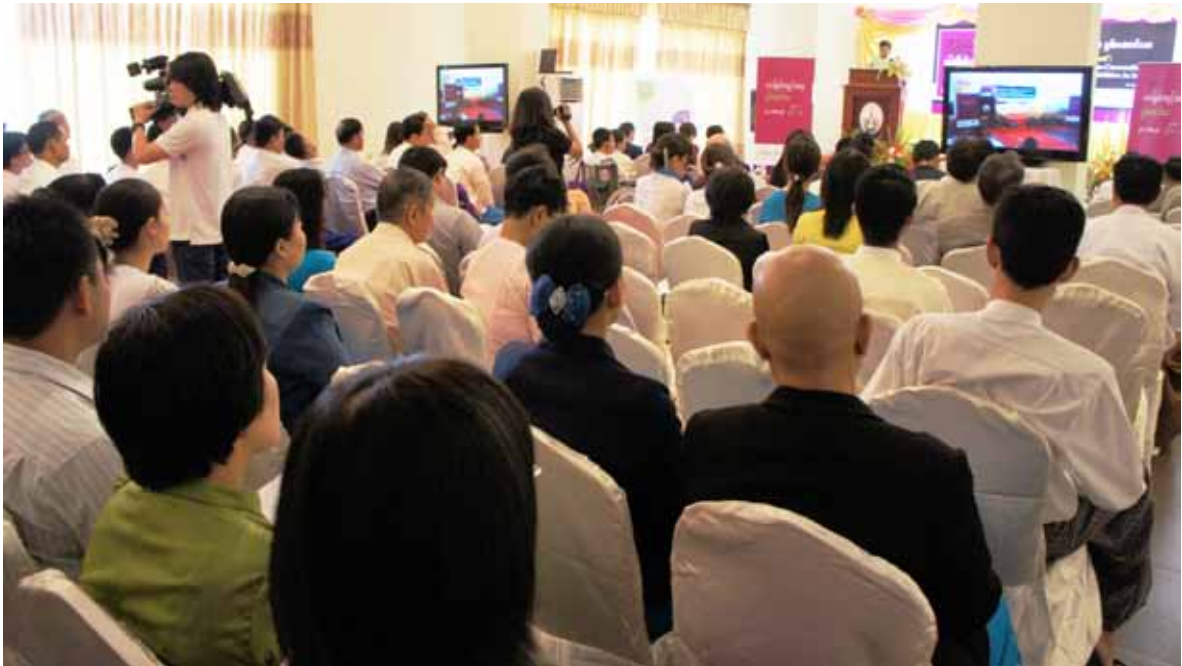
Celebration of the ratification of the United Nations Convention on the Rights of Persons with Disabilities