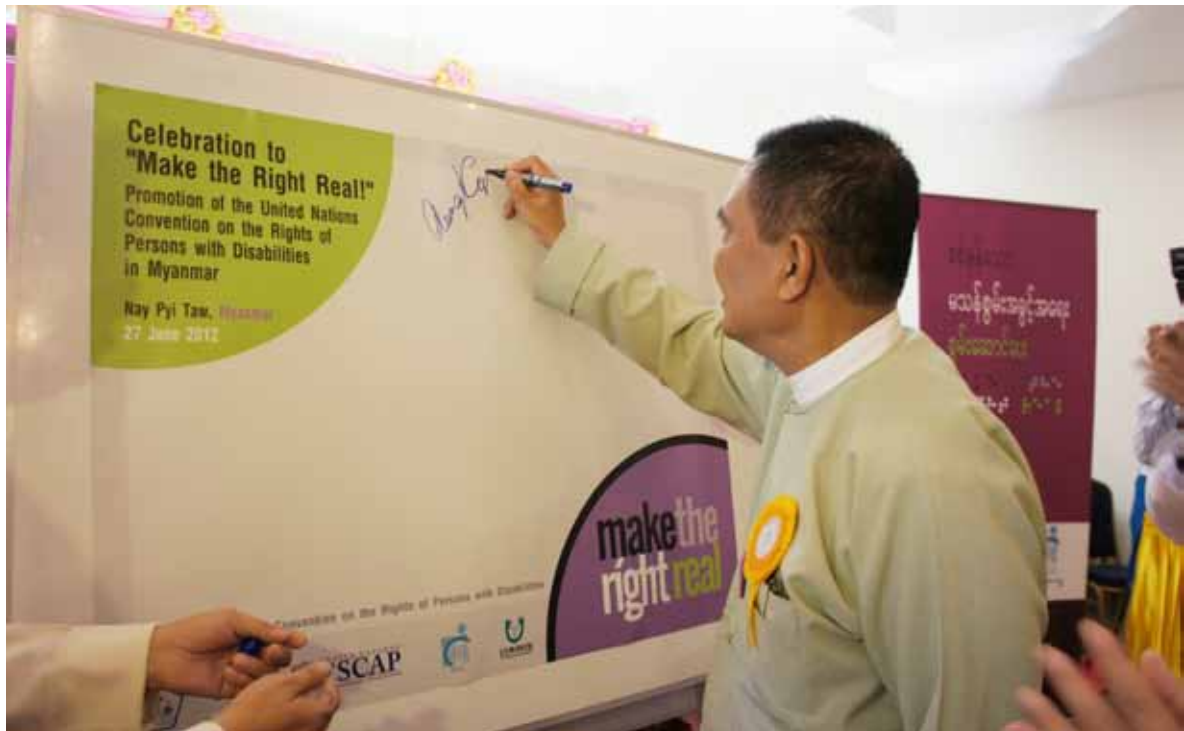
Singing Pledge Board by the Union Minister