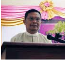
Welcome speech by H.E. U Aung Kyi Union Minister Ministry of Social Welfare, Relief and Resettlement