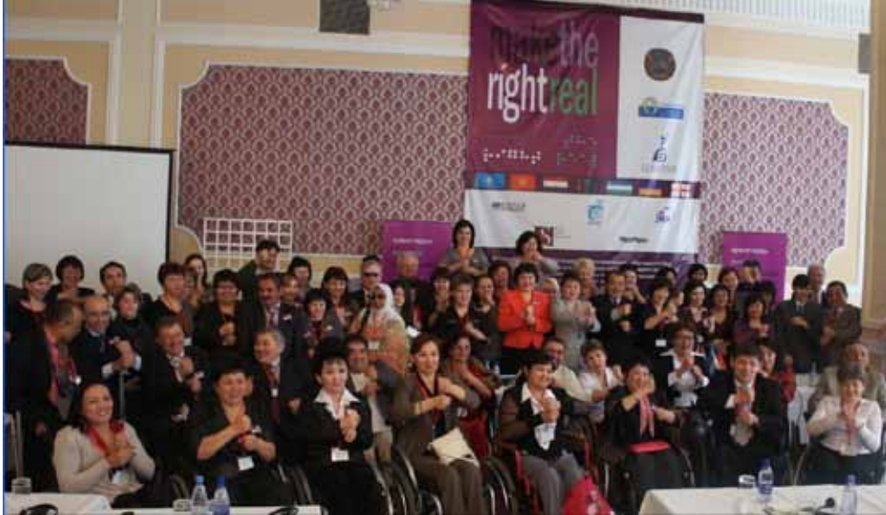
“Make the Right Real” in Local Sign Language