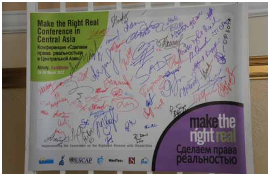
Signing the Pledge Board to Support Make the Right Real! campaign