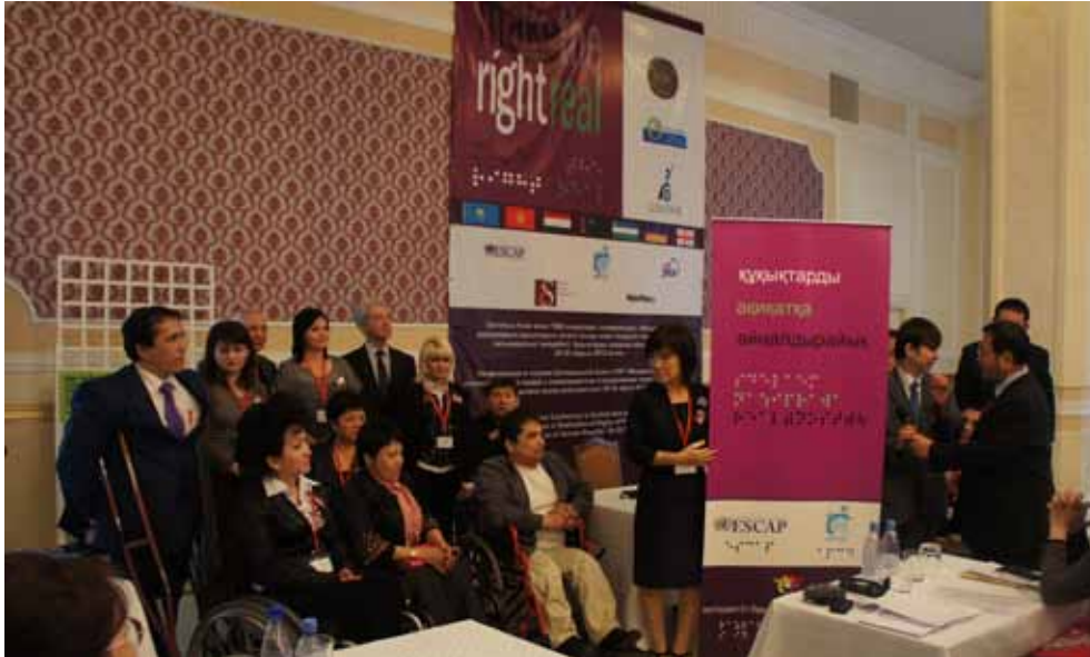
Presentation “Make the Right Real” Roll-up to CADF Members