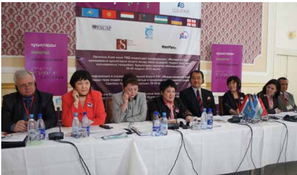
Opening Ceremony (the Government of Kazakhstan and other partners)